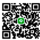
คณะบริหารธุรกิจ