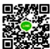
คณะศิลปศาสตร์

***** แจ้งหลักฐานการโอนเงิน ค่ากิจกรรมคณะ ผ่าน QR CODE ของคณะที่นักศึกษาสังกัด*****