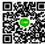
คณะวิศวกรรมศาสตร์