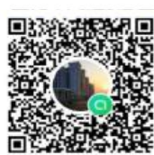
คณะอุตสาหกรรม และเทคโนโลยี