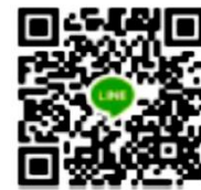
คณะอุตสาหกรรมการ โรงแรมฯ